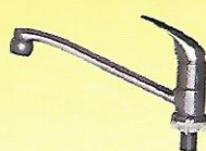
Y 320 C 1/2" : 45 / 3