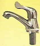
Y 316 FA 1/2" : 60 / 5