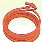
PIPE PE-X 1/2" : - / 50 m 3/4" : - / 50 m 1" : - / 50 m