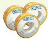
SEAL TAPE 12 mm : 600 / 60 25 mm : 600 / 30