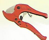
GUNTING PIPA PE-X 48 / 12