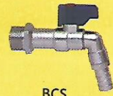
BCS 1/2" : 240 / 12