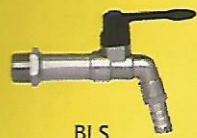
BLS 1/2" : 240 / 12 3/4" : 120 / 10