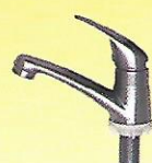
Y 321 C 1/2" : 60 / 5