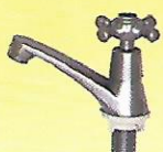
Y 319 CU 1/2" : 75 / 5