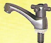
Y 318 CA 1/2" : 60 / 5