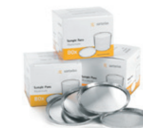
Pratos de amostras descartáveis

* DAKKS: Organismo Alemão de acreditação reconhecido por toda Europa.