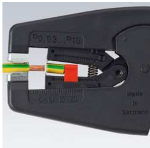
Dénudage précis de 0,03 à 10,0 mm 2 sans réglage