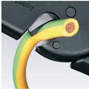
Coupe-fils pour fils multifilaires jusqu'à 10,0 mm 2