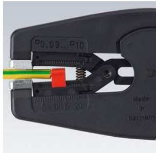
Mâchoires en acier à tranchants empêchant le câble de glisser